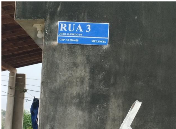
FOTO 22: Pavimentação em paral. Graníticos - Rua 03 / Sinalização