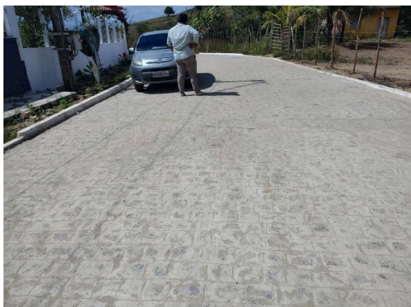
FOTO 3: Pavimentação em paral. Graníticos - Rua 01 / Final da Rua