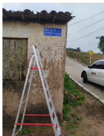
FOTO 21: Pavimentação em paral. Graníticos - Rua 03 / Sinalização