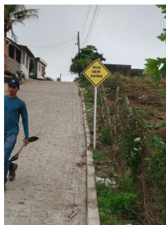
FOTO 20: Pavimentação em paral. Graníticos - Rua 03 / Sinalização