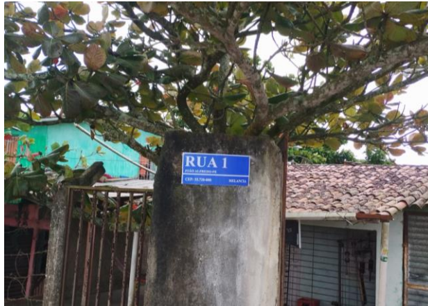
FOTO 12: Pavimentação em paral. Graníticos - Rua 01 / Sinalização