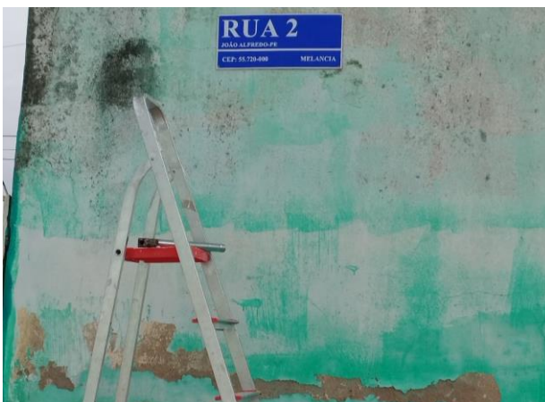
FOTO 16: Pavimentação em paral. Graníticos - Rua 02 / Sinalização