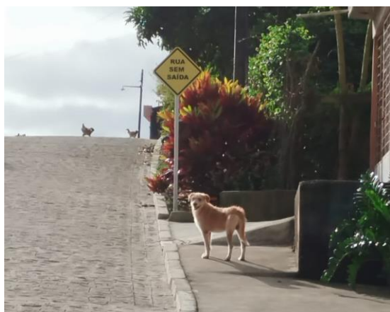
FOTO 17: Pavimentação em paral. Graníticos - Rua 02 / Sinalização