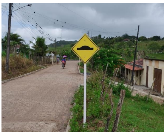
FOTO 11: Pavimentação em paral. Graníticos - Rua 01 / Sinalização