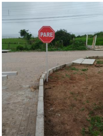
FOTO 19: Pavimentação em paral. Graníticos - Rua 03 / Sinalização

OBRA: PAVIMENTAÇÃO EM PARALELEPÍPEDOS GRANÍTICOS, SINALIZAÇÃO E DRENAGEM DE DIVERSAS RUAS NO SÍTIO MELANCIA, MUNICÍPIO DE JOÃO ALFREDO - PE.