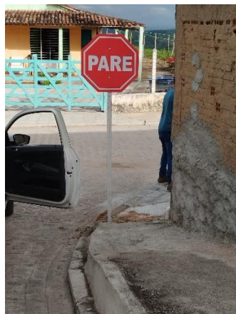
FOTO 18: Pavimentação em paral. Graníticos - Rua 02 / Sinalização