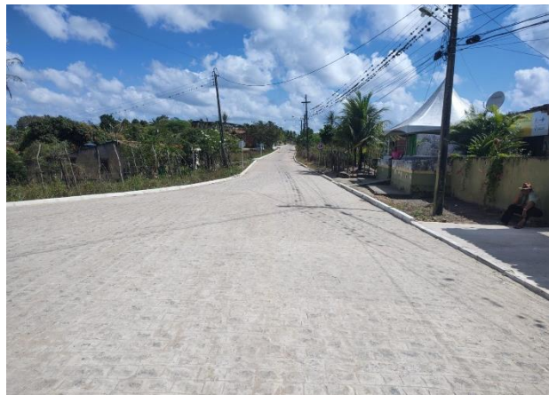
FOTO 4: Pavimentação em paral. Graníticos - Rua 01 / Final da Rua