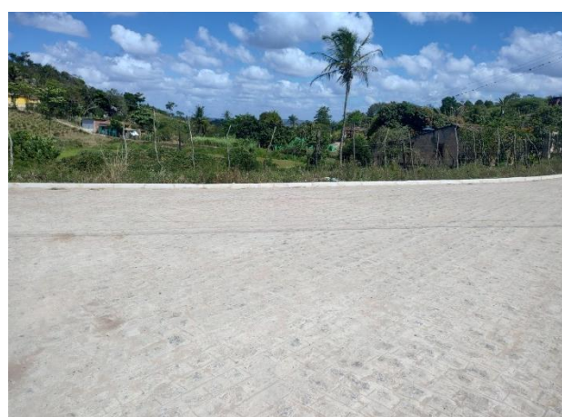
FOTO 6: Pavimentação em paral. Graníticos - Rua 01 / Final da Rua