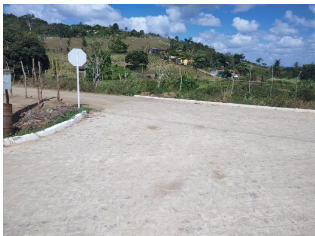
FOTO 5: Pavimentação em paral. Graníticos - Rua 01 / Final da Rua