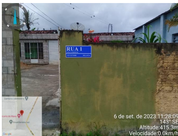
FOTO 14: Pavimentação em paral. Graníticos - Rua 01 / Sinalização