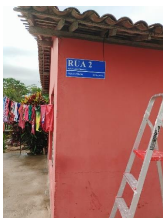
FOTO 15: Pavimentação em paral. Graníticos - Rua 02 / Sinalização