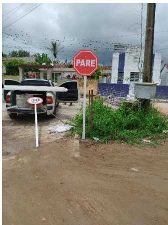
FOTO 13: Pavimentação em paral. Graníticos - Rua 01 / Sinalização

OBRA: PAVIMENTAÇÃO EM PARALELEPÍPEDOS GRANÍTICOS, SINALIZAÇÃO E DRENAGEM DE DIVERSAS RUAS NO SÍTIO MELANCIA, MUNICÍPIO DE JOÃO ALFREDO - PE.