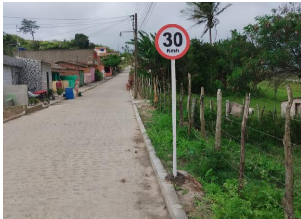
FOTO 10: Pavimentação em paral. Graníticos - Rua 01 / Sinalização